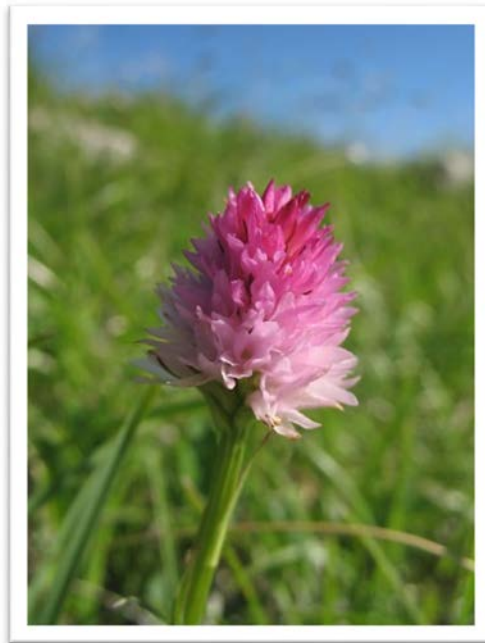
Ena naših murk – kamniška murka ( Nigritella lithopolitanica ).