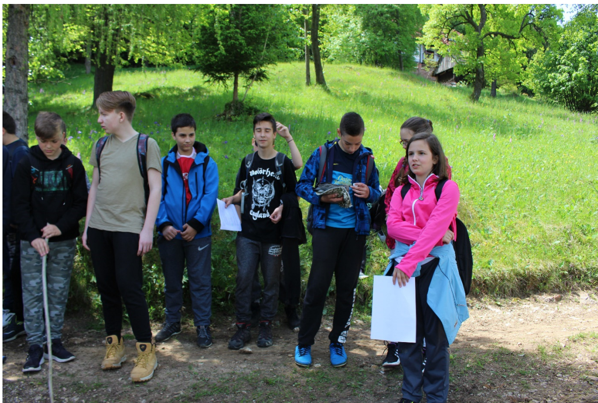
Slika 6: Igra vlog je za otroke zabaven način učenja