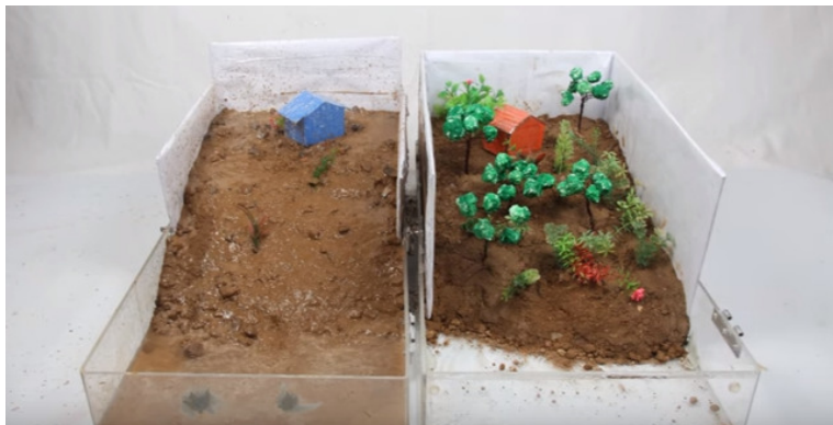
Slika 3: Modela za prikaz pomena struktur za plazenje

katero nasujejo prst. Nato na pobočje postavijo model hiše in z vrha po pobočju počasi zlivajo vodo. Enako ponovijo še z drugim modelom, vendar pri tem v prst vstavijo še modele dreves s koreninami. Lahko uporabijo tudi prave šope trave. Opazujejo, kaj se dogaja pri enem in drugem modelu. Op.: Za boljši prikaz in lažjo postavitev dreves, naj bo pri drugem modelu prst že nekoliko navlažena.