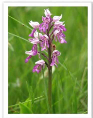
Dolgoliostna naglavka ( Cephalanthera longifolia ) - levo, škrlatna kukavica ( Orchis purpurea ) – na sredi in čeladasta kukavica ( Orchis militaris ) - desno.