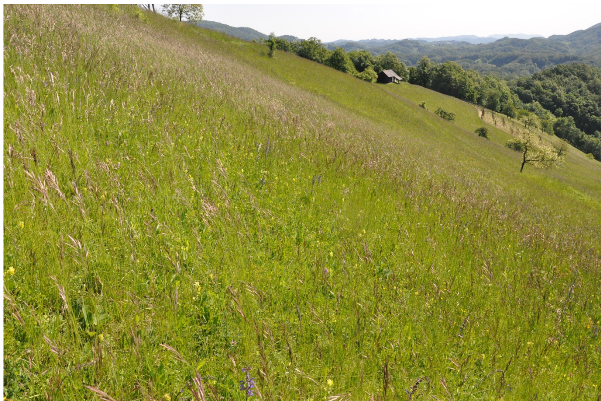
Suhi travnik – Haloze