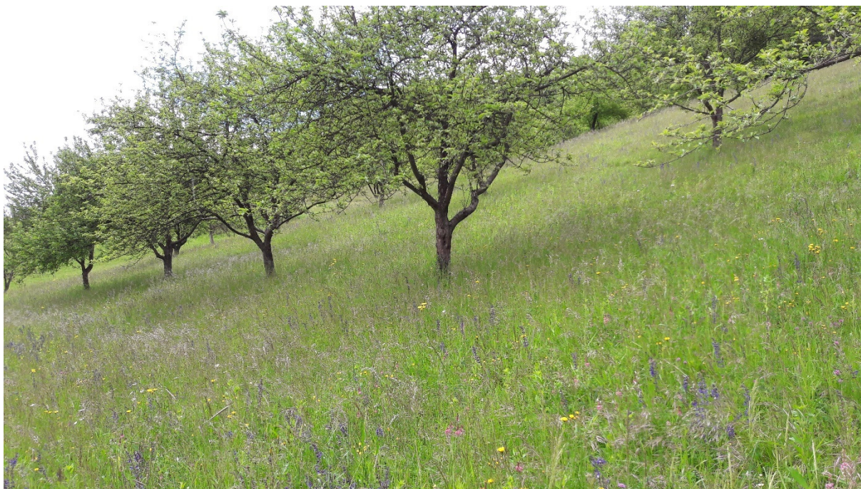
Slika 7: Vrsta pestrost sadnega drevja v visokodebelnem travniškem sadovnjaku