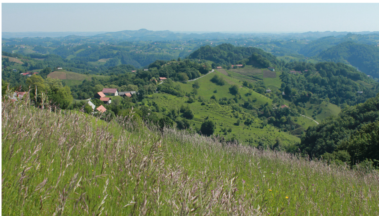
Slika 1: Suhi travniki in mozaičnost krajine v Halozah

Pomembno dopolnitev travniškega ekosistema predstavljajo visokodebelni travniški sadovnjaki. Drevesa s krošnjami nudijo zatočišče številnim pticam, ki si tu izdolbejo dupla. Pestra je tudi favna žuželk, zlasti ko drevesa cvetijo in plodijo. Žuželke drevo oprahujejo in so hkrati hrana drugim živalim: pticam, netopirjem, pajkom... Tako kot travnik je tudi visokodebelni travniški sadovnjak plod človekovega dela in ga je potrebno primerno vzdrževati z zmerno košnjo trave ali pašo živine, pomladitveno rezjo dreves vsakih nekaj let ter nadomeščanjem starih in propadlih dreves z novimi.