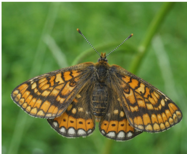
Lastovičar – levo, travniški postavnež - desno