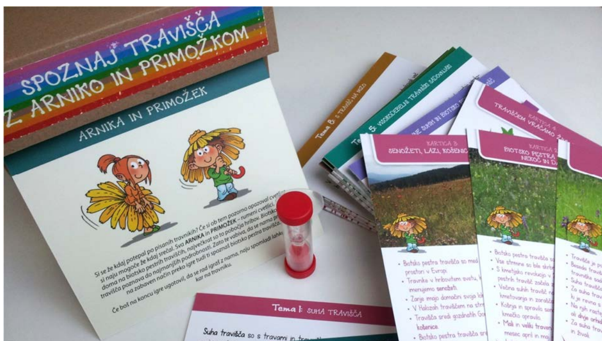
Slika 8: Didaktični pripomoček – igralne karte: »Spoznaj travišča z Arniko in Primožkom«

Vsebina: Če ste se že kdaj sprehajali po pisanih cvetočih travnikih, ste zagotovo že uzrli dve rumeni cvetlici – arniko in primožka. Rumeni cvetlici, ki domujeta na biotsko pestrih traviščih, največkrat so to pobočja hribov, sta maskoti traviščne učilnice. Učence vabita, da se jima pridružijo in na zabaven način preko igre spoznajo biotsko pestra travišča.