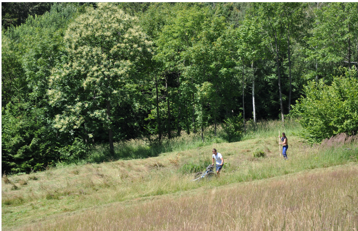
Slika 4: Strme in težje dostopne travnike je potrebno kositi s strižno kosilnico.