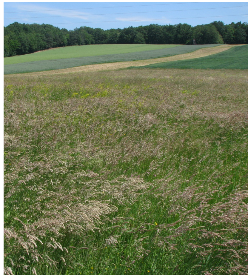
Negojeni travnik - levo (foto: Monika Podgorelec), gojeni travnik – desno (foto: Monika Podgorelec)