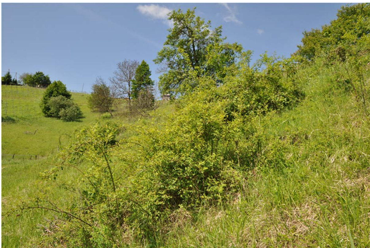
Slika 2: Prisotnost različnih struktur na suhem travniku pozitivno vpliva na biotsko pestrost, vendar pa se s preobsežnim zaraščanjem pojavi negativni vpliv, saj travnik preide v grmišče in gozd