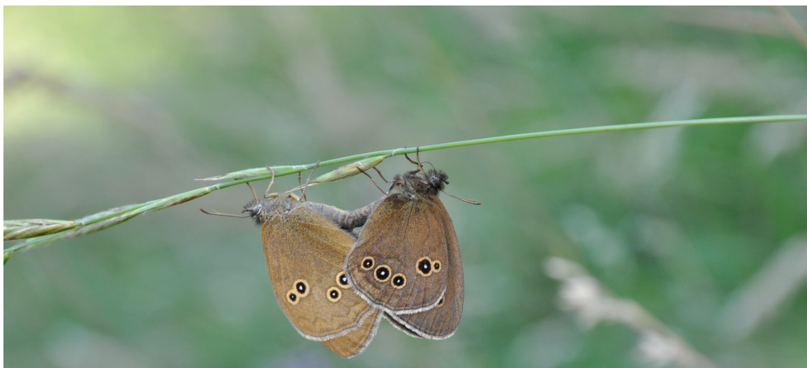
Slika 5: Metulji (na fotografiji je okati rjavec ( Aphantopus hyperanthus )) so tipični predstavniki travniških organizmov, saj za svoj razvoj potrebujejo prisotnost hranilnih rastlin, na katere samice odlagajo jajčeca, z njimi pa se največkrat prehranjuje tudi gosenica, ki se iz jajčeca razvije